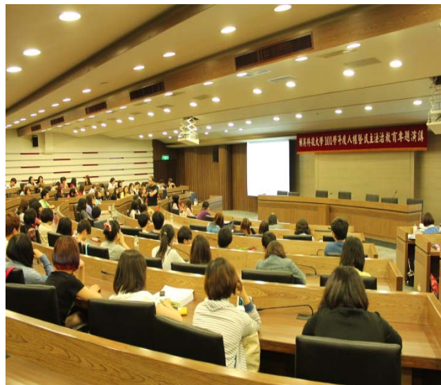
講師以校園發生案件說明人權的保障