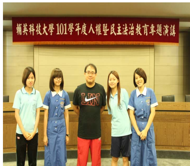
演講結束後講者與學生合影