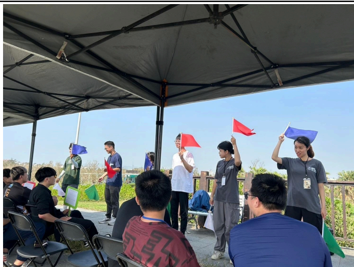
【加分拉力賽的花絮照】