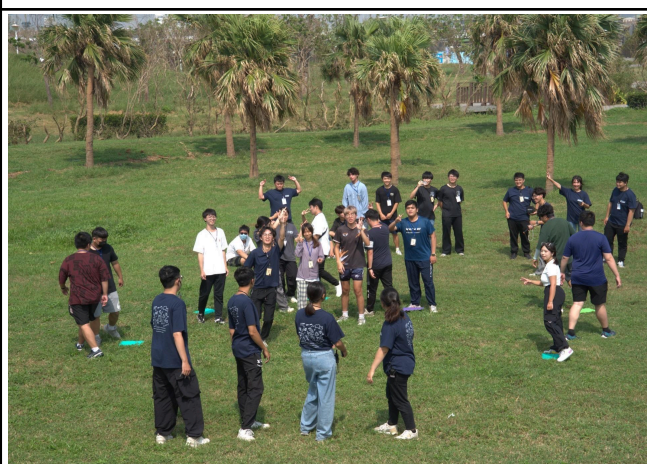
【大地遊戲的花絮照】