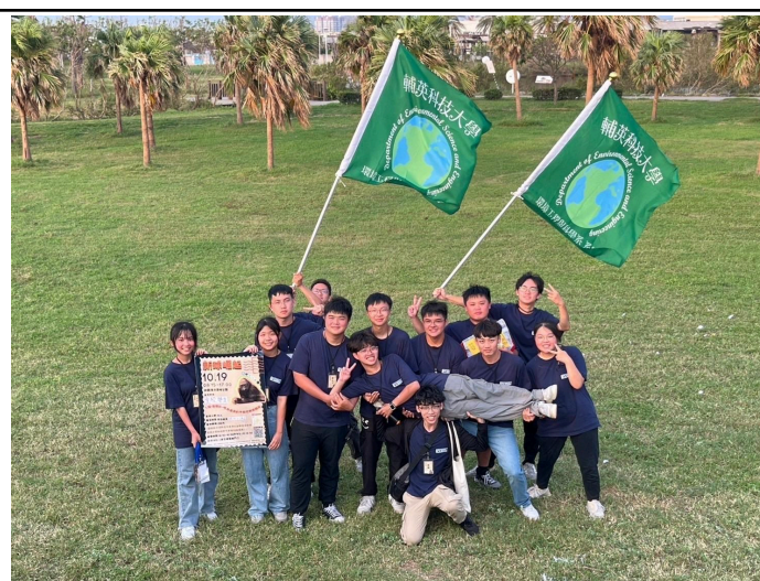
【環工系工作人員合照】