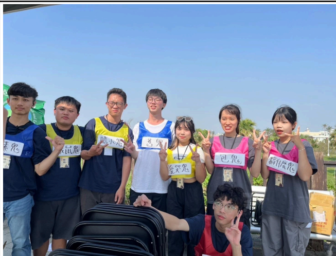
【闖關遊戲的花絮照】