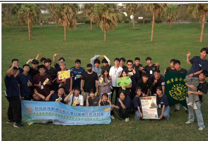
【活動尾聲的大合照】