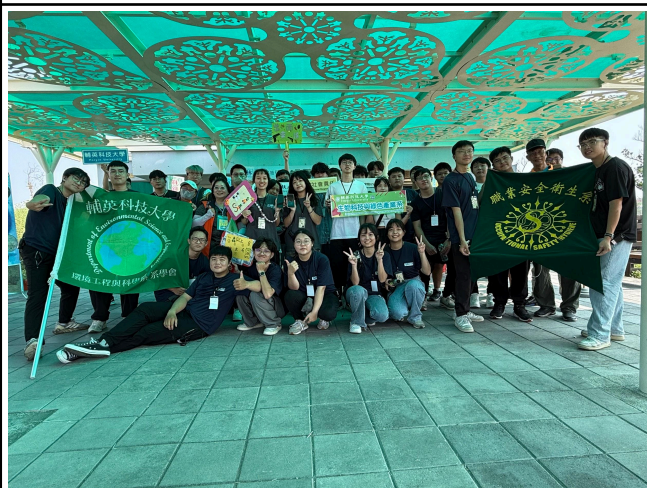
【與林園愛鄉協會理事長 及解說員們大合照】