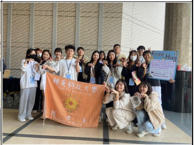
活動當日工作人員團體合照