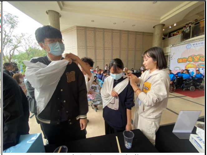
體驗手部固定包紮