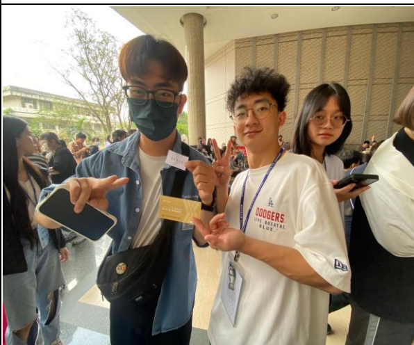
恭喜獲得威秀電影票